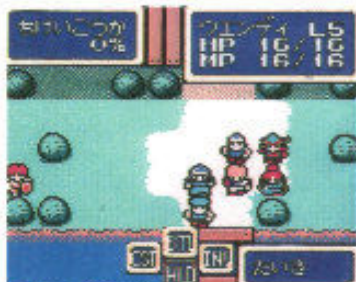
●方向キーの形に合わせたコマンド入力方式もおなじみのものだけ