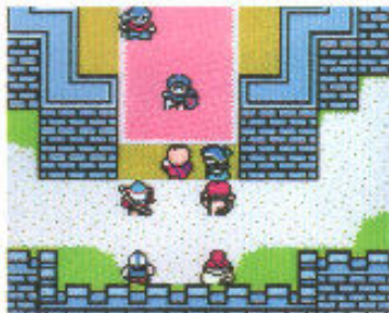
●マップ上のキャラクタが、かわいい上に芸達者なのだ

メガドライブで人気が高かった、シミュレーション的な要素を持つRPG「シャイニング・フォース」。基本的なシステム、世界設定はそのままに、ゲームギアで楽しめる「外伝」が3部作の予定で登場する。シナリオや音楽などはゲームギア独自のものだが、メガドライブ版で活躍したキャラクタなども登場するのだ。