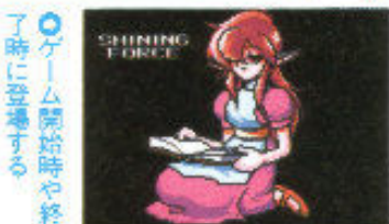
●ゲーム開始時や終了時に登場する