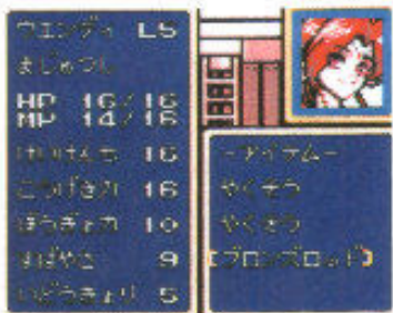
●キャラクタたちのステータス画面。もちろん敵のデータも見れるぞ