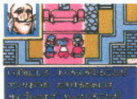
●敵の断末魔の叫び。一時的休息が訪れる

ディアネ、タオの妹で、強力な攻撃魔法を操るエルフの魔術師。姉たちの「シャイニング・フォース」自慢に対抗すべく戦いに出るのだ。