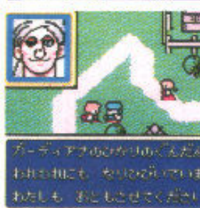
●敵だけではなく、心強い仲間たちも一行と出会う時を待っている