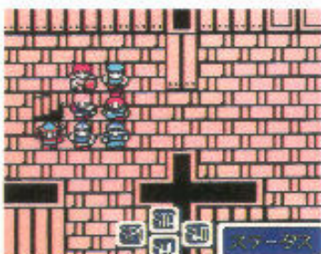
●サブコマンドも欠かせない