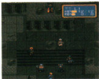
古代遺跡のようなところに集まった主人公たち。これから戦うのか?

この老人はどんな人かというところから、若いころからグランシール国に入り、現在では王様にも影響を与えることができるほど。当然、グランス島じゅうにその名